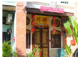
Georgetown, Penang, Malaisie

J'ai visité la très belle île de Tioman, puis le parc national de Taman Negara (plus de 4000 km 2 de forêt tropicale avec de nombreux animaux emblématiques tels que tigres, ours, tapirs, éléphants - mais je n'en ai vu aucun, ceux-ci étant bien dissimulés dans la forêt épaisse). Après une belle montée jusqu'à plus de 1500 mètres d'altitude, au centre du pays, je suis arrivé aux Cameron Highlands où l'on cultive le thé.